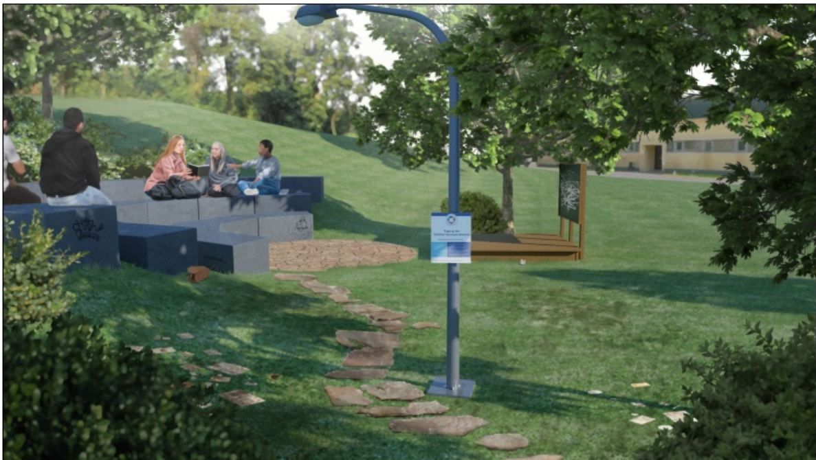
Abb. 2: Screenshot aus dem Serious Game „BNE Room “: Naturklassenzimmer

Die versuchte Konklusion und erfahrungsbezogene Exemplifizierung von C (Z. 4-7, Z. 11-12) ist ein vermeintlicher Widerspruch zum geteilten Orientierungsrahmen der Gruppe. Im Zuge der weiteren Aushandlung stimmt C den Gruppenmitgliedern jedoch zu (Z. 35), sodass die Sequenz den Orientierungsrahmen der Gruppe zwischen Normativität und Pragmatik aufzeigt. Insbesondere die Sprecher*innen B und D verhandeln dabei eine angenommene Unvereinbarkeit von Unterricht und Partizipation, indem B eine Praxiserfahrung und D normative Setzungen einführt (Z. 11-12, Z. 24-25). Die Reduktion der Idee des Kummerkastens im Sinne einer Handhabbarkeit deckt eine Orientierung am Primat des Unterrichts als Zeit und Raum für Lernprozesse auf, die scheinbar nicht mit partizipativen Elementen, wie die Thematisierung der Sorgen der Schüler*innen, zu vereinbaren sind und deshalb dem Unterricht untergeordnet werden.